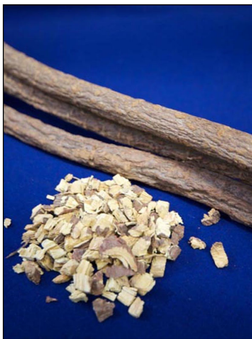
図2 生薬として用いられる甘草根ときざみ(甘草根をきざんだもの)