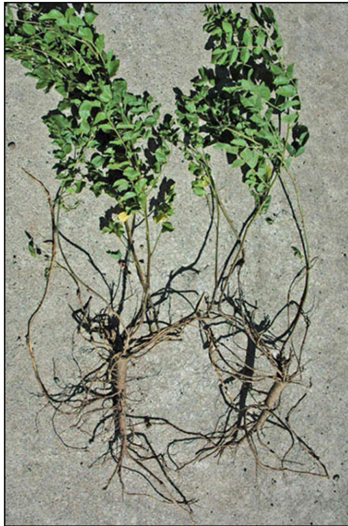
図1 カンゾウ植物を掘り起こしたもの