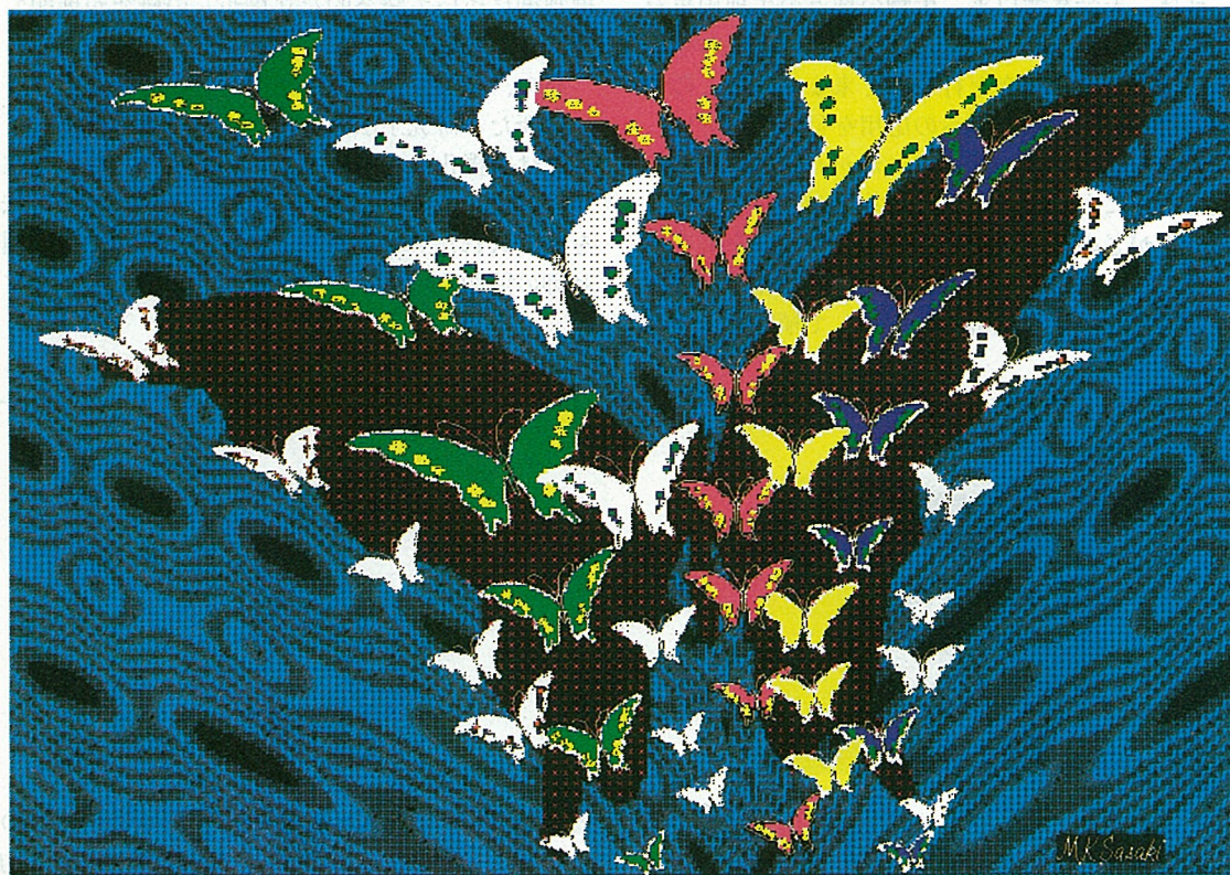
図3. "Butterfly March"